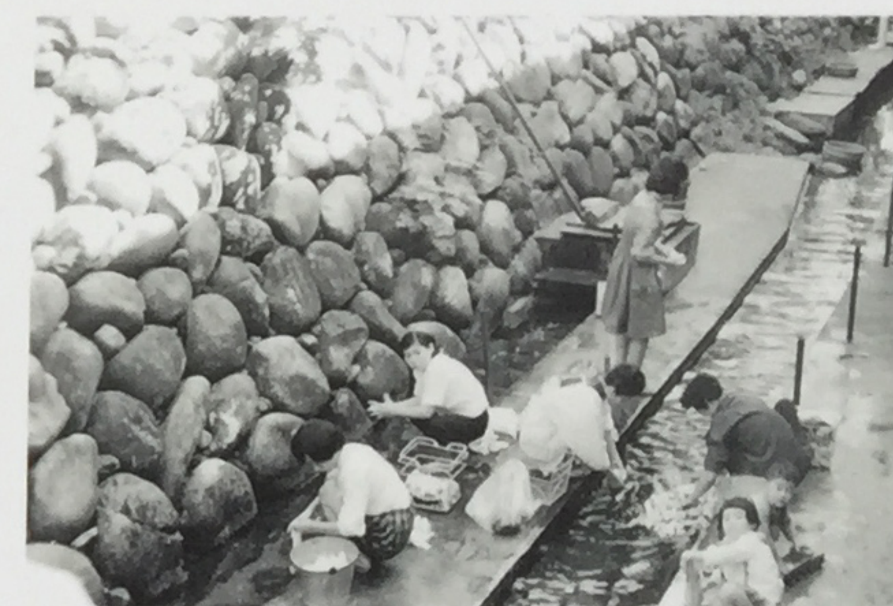
大清水周辺の昭和37年当時の写真 Historical Picture of Oshozu Spring(1962)

A Place of Interaction: Full of Enjoyment For the townspeople of Katsuyama, Oshozu Spring was a place to gather and interact. Until around 1955, the canal that flowed from the spring was used as a sort of natural refrigerator. Regardless of where the people gathered, whether it was at the upper part of the stream to wash fruits and vegetables, or the lower part of the stream to do laundry, they would always be able to have lively conversations and enjoy each others' company.